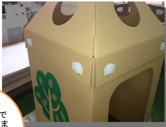
ジョイント付けて完成です。