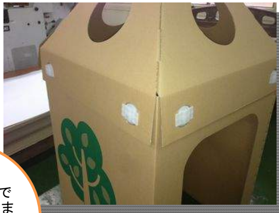
ジョイント付けて完成です。